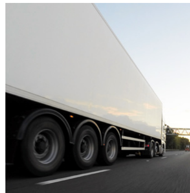
Professioneller Umzugsservice für Elektronenmikroskope