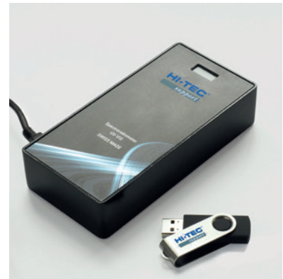
HTS-Spektroradiometer ColorBrick 2.0